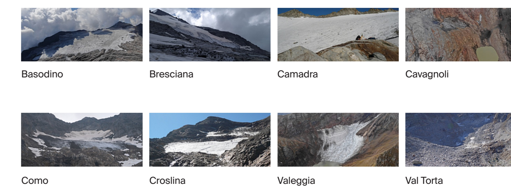
Basodino, Bresciana, Camadra, Cavagnoli, Como, Crosolina, Valeggia, Val Torta

La piccola era glaciale ha caratterizzato le alpi tra il 1300 e il 1850 d.c. Il loro ritiro è continuato raggiungendo oggi lo stadio più arretrato degli ultimi 5'000 anni.