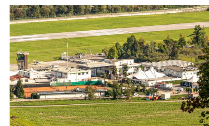
Torre di controllo