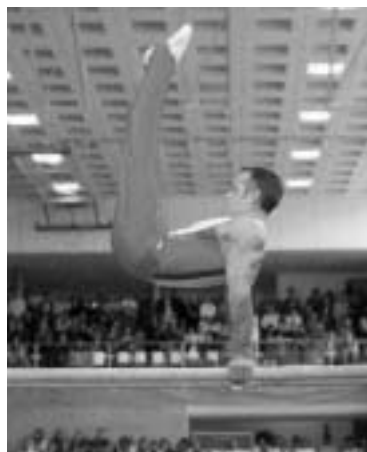
Nelle immagini: la società schierata e Jordan Jovtchev nei festeggiamenti del 2007