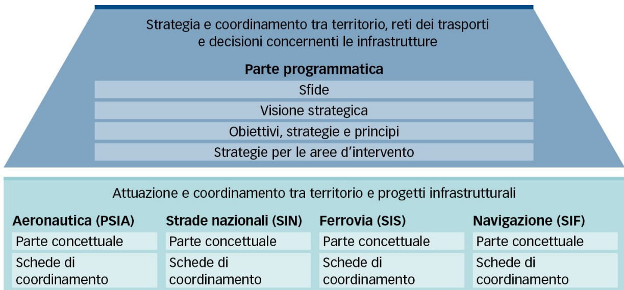
Figura 1: Il Piano settoriale dei trasporti è costituito da una parte programmatica e da quattro parti riguardanti le infrastrutture stradale, ferroviaria, aeronautica e della navigazione.

I piani settoriali sono gli strumenti di pianificazione più importanti della Confederazione. Tramite i piani settoriali, il Consiglio federale adempie i propri compiti in diversi ambiti, mostra quali sono gli obiettivi perseguiti e come intende agire. I piani settoriali aiutano le autorità di tutti i livelli a prendere decisioni con una visione globale e a coordinare i compiti d'incidenza territoriale della Confederazione con le attività dei Cantoni e dei Comuni.