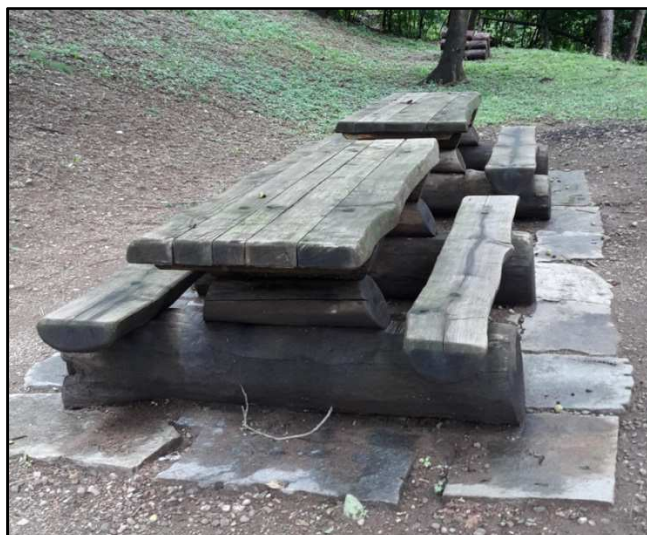
Esempio di Tavoli e panchine