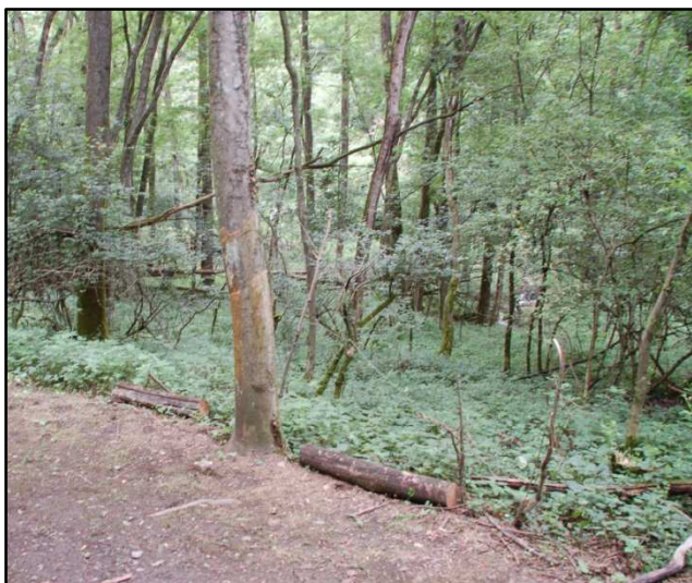
Situazione attuale area scelta