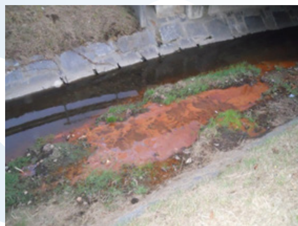
Fotografia 2: depositi di ossido di ferro e manganese con delle iridescenze a cristalli in superficie